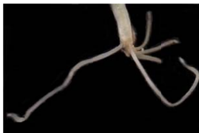
شکل ۱. نمونه‌ای از عکس اسکن شده.

محلول فیکساتور (اتانول، اسید استیک، فرمالدهید) نگهداری شد. از ریشه‌ها توسط میکروسکوپ (مدل Leica Galen III) و دوربین دیجیتال متصل به آن عکس‌برداری انجام